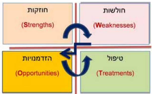
איור 1: תבחני מטריצת מודל ה-SWOT להערכת תוצרי ביצוע (החצים מצביעים על שלבי המילוי)

המודל המקורי הותאם להערכת תוצרים בקורס על ידי הסבת תבחין ה"איומים" (Threats) לתבחין "טיפול" (Treatments). איור מס' 1 מציג את מטריצת מודל SWOT כפי שמתייחסת לדרישות של קורסים אקדמיים. המטריצה כוללת חוזקות (Strengths) - זיהוי ואבחון נקודות החוזק, יכולות ומצבים חיוביים של המטלה המוצגת, שמיועדים לאפשר לסטודנט לממש את השגת מטרותיו; חולשות (Weaknesses) - זיהוי ואבחון אי-יכולות ומצבים שיכולים למנוע מהסטודנט להשיג את מטרותיו הרצויות; הזדמנויות (Opportunities) - זיהוי ואבחון גורמים ומצבים שיכולים לעזור לסטודנט להשיג מטרותיו, אך טרם נוצלו על ידו בתוצר המוצג; וטיפול (Treatments) - הצגת הצעות אופרטיביות לשיפור הנדרש, כפי שצויין בחולשות ו/או בהזדמנויות שלא נוצלו על ידי הסטודנט.